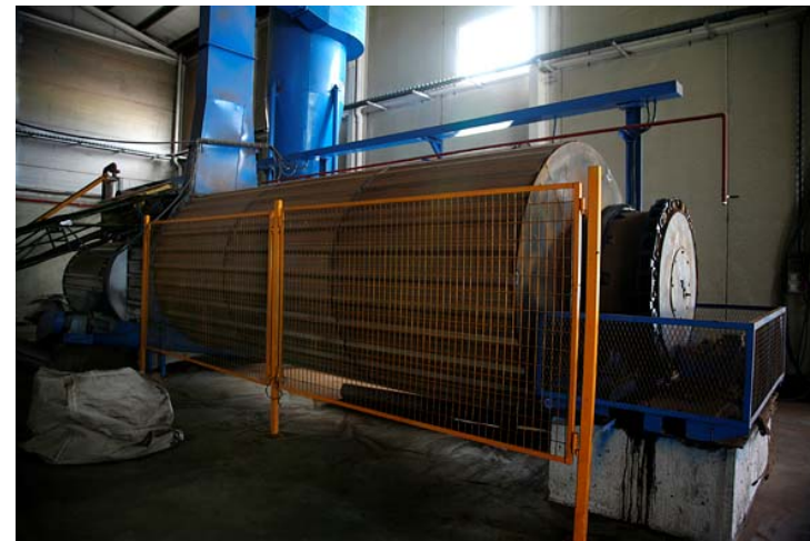
SECADERO + TROMMEL + CICLON