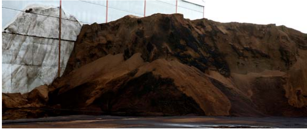
ACOPIO DE MATERIA PRIMA